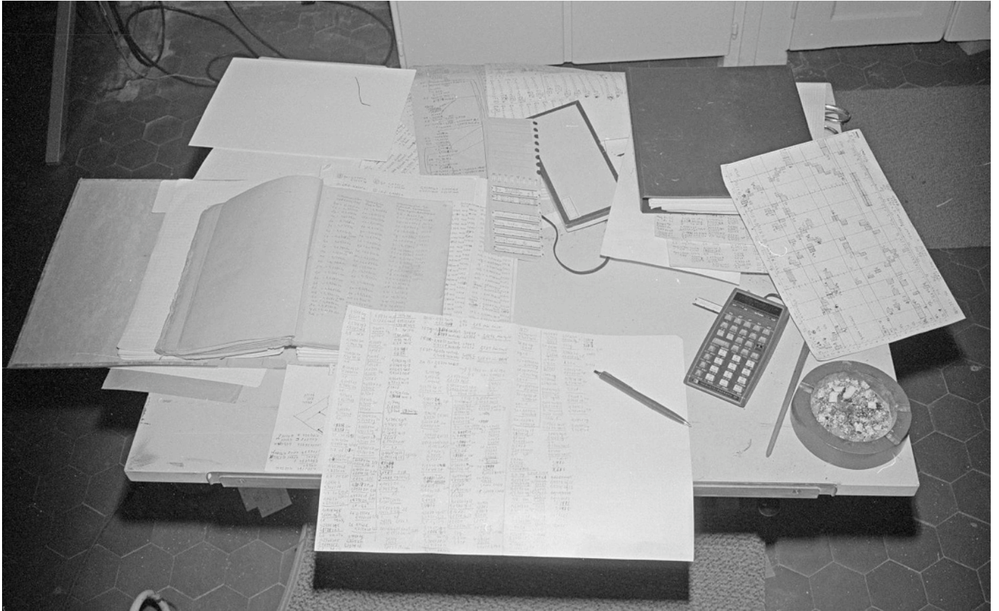
Jakob Weders Arbeitstisch in seinem Atelier in der Küche des alten Spitals an der Bettenhausenstrasse 50 in Herzogenbuchsee. Ca. 1978.

Jakob Weders Bilder beruhen auf jahrzehntelanger Farbforschung. Sie entstanden nach jeweils umfangreichen, wissenschaftlichen Berechnungen. Diese waren in der grossen Zahl für die bis zu 2'500 verschiedenen Farbfelder pro Bild nur mit Hilfe eines Kleincomputers und der (von seinem Sohn) eigens dafür entwickelten Programme möglich.